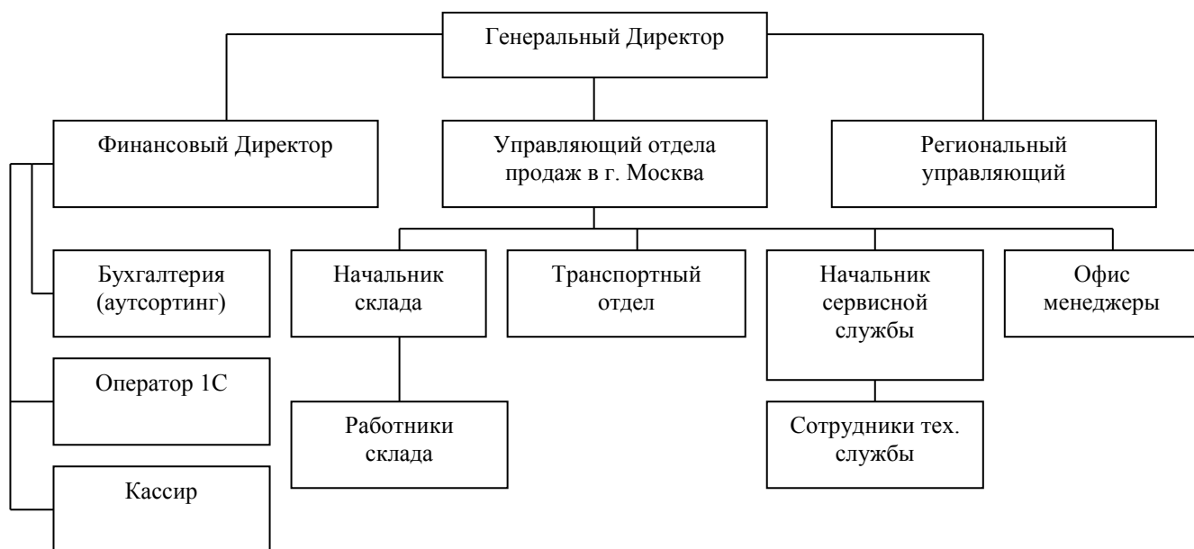
Рис. 2.2.1. Организационная структура управления ООО «XXX»