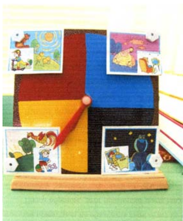
Рис. 2. Модель «время суток» к дидактической игре «Кто в какое время суток работает»