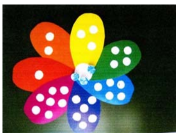
Рис. 3. Календарь «Неделя»