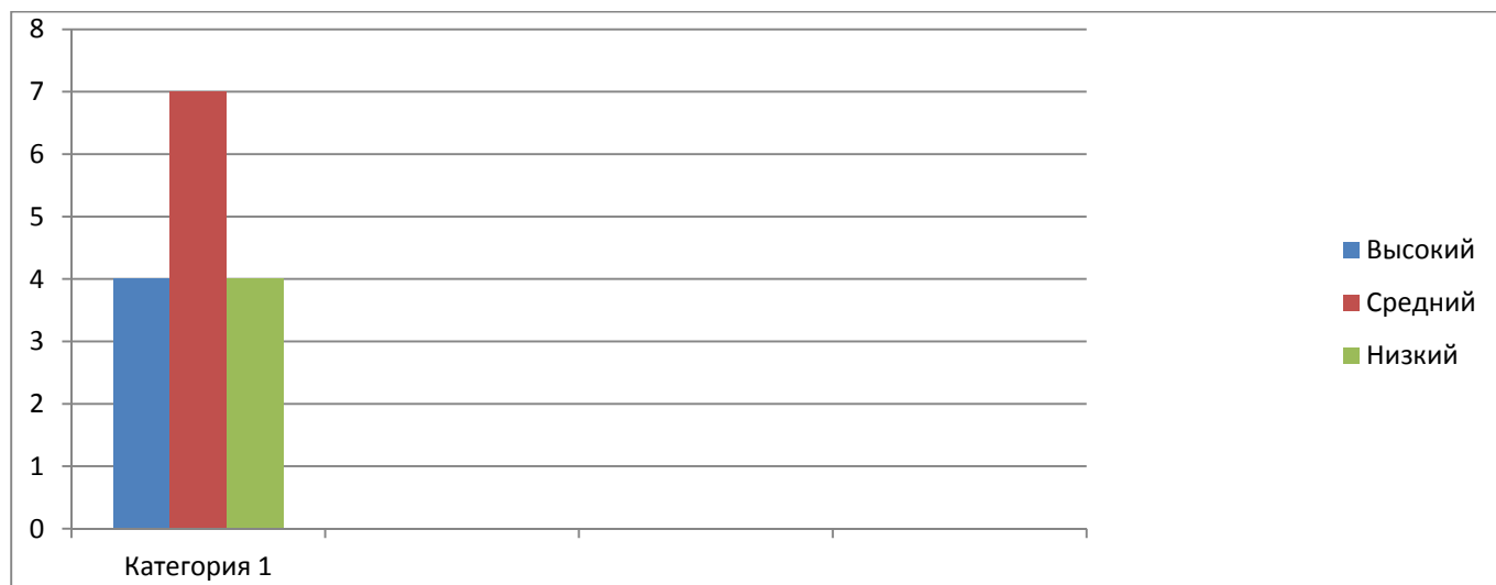
Гистограмма 2. Обобщающие результаты уровня сформированности представлений о времени у детей шестого года жизни на констатирующем этапе исследования